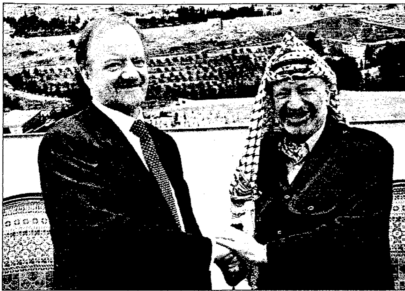
عرفات يرحب بالوزير البريطاني في مكتبه في غزة أمس